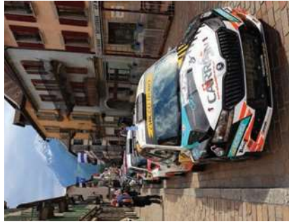
UPSA-VD soutient le Rallye du Chablais