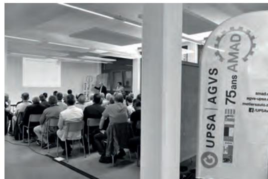
75 ans AMAD