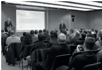
Séance information entreprises formatrices.

J'aime les sports d'hiver : je pratique depuis longtemps le snowboard, et j'ai recommencé le ski l'hiver dernier ; la montagne est une passion ! Je suis aussi une épicurienne et apprécie de partager de bonnes tables. Côté évasion, j'envisage un voyage de plusieurs mois sac à dos avec mon copain.