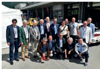
Conférence des présidents, la photo de famille

Vendredi 1 er juin 2018, dans le cadre du Rallye du Chablais, Aigle, Arsenal Militaire.