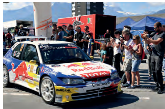
75 ans AMAD, partie récréative, Rallye du Chablais