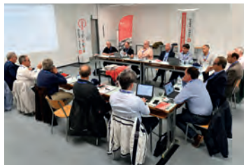
Conférence des présidents

Lorsqu'il est l'heure, pour les présidents latins de l'UPSA et leur président central à Berne, de se retrouver dans le pays de Vaud pour évoquer de nombreux thèmes directement liés à la branche des garages, quoi de plus naturel que de le faire au milieu des bolides prêts à en découdre lors d'une manche de championnat suisse des rallyes, dont les célèbres pilotes Sébastien Loeb et Ari Vatanen ont assuré l'ouverture.